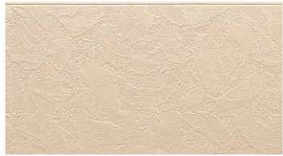
EA1632H MFクリームベージュE