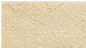
EA1638H MFベビーアイボリーF