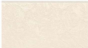
EA1631H MFミルキーホワイトH