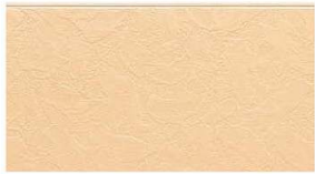
EA1633H MFハーベストイエローF